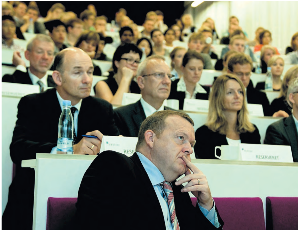
Regeringens Vækstforum mener, at stagnerende produktivitet og begrænset innovationsevne er blandt de største udfordringer, Danmark har i øjeblikket.